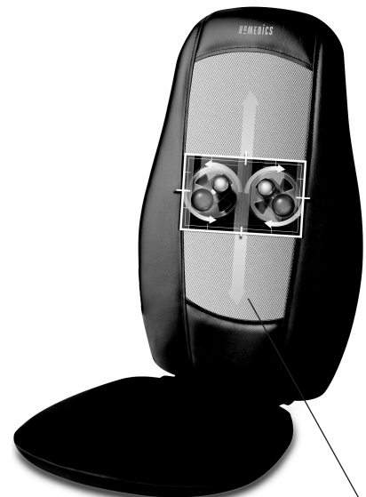
Mecanismo en movimiento para el masaje Shiatsu

ATENCIÓN: La unidad se apaga automáticamente después de 15 minutos, por seguridad.